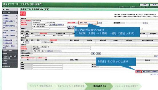
▲マニフェスト情報の修正の一部抜粋