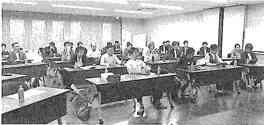
ライト光機様にて

うため、ホコリが一つも落ちていないように感じるほどきれいでした。また、トレーニングルームやきれいな食事スペースといった施設が整い、羨望の眼差しの中、見学は終了となりました。