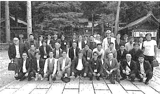
諏訪大社集合写真

次の目的地である諏訪大社(上社)では記念撮影をしました。県外からの参加者の多くは初めて参拝したということもあり、じっくりと境内を見て回り、お土産店でソフトクリームを購入し美味しそうに食べている方も見受けられました。諏訪大社参拝後は自由散策の時間となり、各々が諏訪湖観光を楽しんだようです。