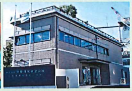
京都環境保全公社株式会社(本社)