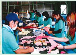
山本清掃京丹波ウエス