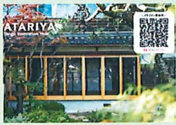
ATARIYA Tango Innovation Hub