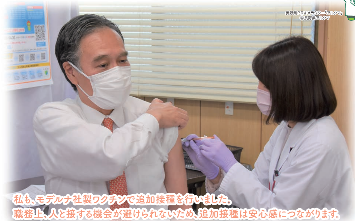
私も、モデルナ社製ワクチンで追加接種を行いました。 職務上、人と接する機会が避けられないため、追加接種は安心感につながります。