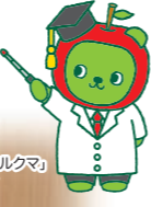
長野県PRキャラクター「アルクマ」