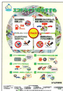
▲エコドライブ10のすすめポスター (無料)