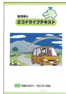
▲乗用車のエコドライブテキスト (200円/冊)