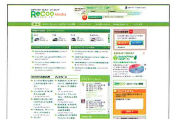
▲燃費管理支援サイトReCoO (無料/別途登録必要)