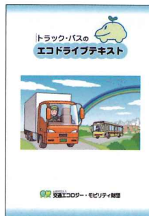
▲トラック・バスのエコドライブテキスト (200円/冊)