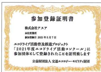
▲コンクール参加登録証明書 (電子データのみで提供)