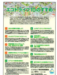
▲エコドライブ10のすすめチラシ・リーフレット (無料)