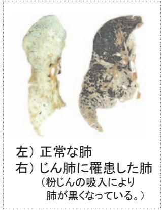
左) 正常な肺 右) じん肺に罹患した肺 (粉じんの吸入により肺が黒くなっている。)

現在、じん肺を治す根本的な治療がないため、じん肺にかからないための措置として、粉じんの発生源対策、局所排気装置等の適正な稼働、呼吸用保護具の適正な着用などにより、粉じんへの「ばく露防止対策」を徹底することが重要です。