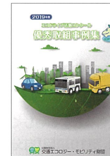
▲優秀取組事例集 (電子データのみで提供) (無料)