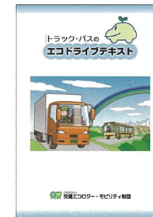
▲トラック・バスのエコドライブテキスト (200円/冊)