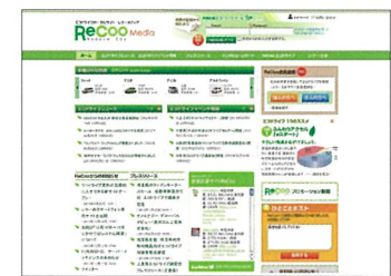
▲燃費管理支援サイトReCoo (無料/別途登録必要)