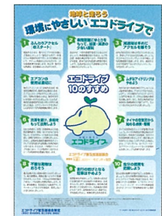
▲エコドライブ10のすすめチラシ (無料)