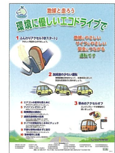
▲エコドライブ10のすすめポスター (無料)