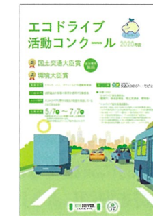
▲コンクールリーフレット (電子データのみで提供)