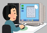
様式をダウンロード