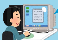
システムへログイン