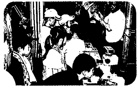
飯山陸送株式会社