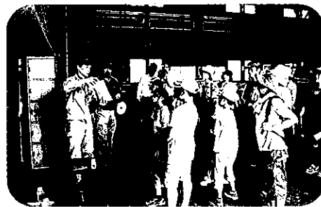
イコールゼロ株式会社